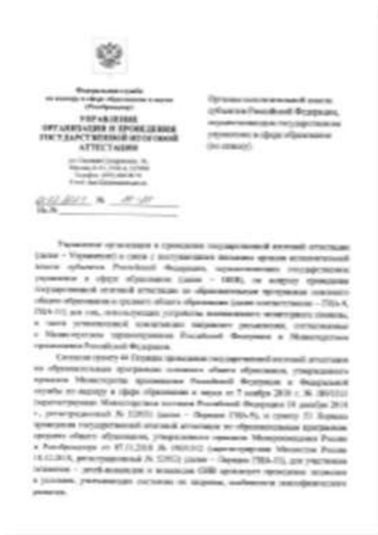
Письмо Федеральной службы по надзору в сфере образования и науки от 01.02.2023 №10-21

ЭЛЕКТРОННОЕ УСТРОЙСТВО ИСПОЛЬЗУЕТСЯ ТОЛЬКО В КАЧЕСТВЕ ПРИСПОСОБЛЕНИЯ ДЛЯ НЕИНВАЗИВНОГО МОНИТОРИНГА ГЛЮКОЗЫ